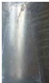
Stav po šesti týdnech zkoušky postřikem sláným roztokem.