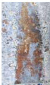
běžné pozinkování Z275